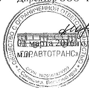
График № 3